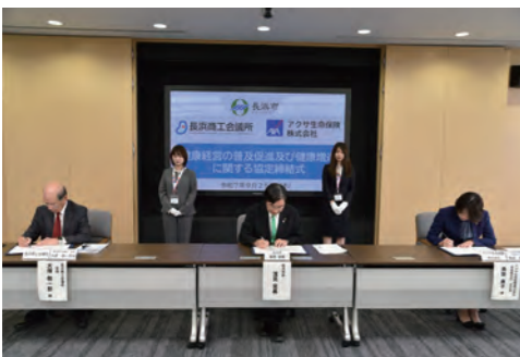
▲アクサ会議所締結式