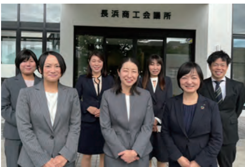
▲私たちがうかがいます！