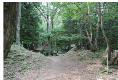
田上山砦(長浜市木之本町黒田)