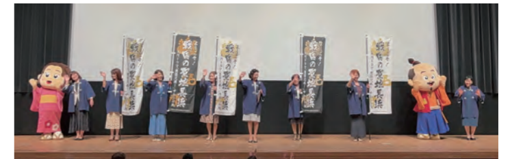
2025.6.5 関女連総会武生大会 次年度開催地\長浜/PR