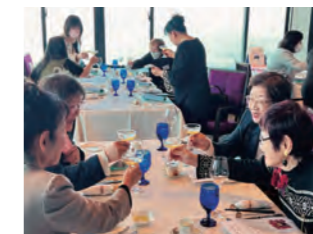
2023.3.6 大府商工会議所女性会との交流