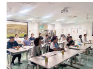
2024.8.21 視察研修 (マリンフード株式会社滋賀工場)