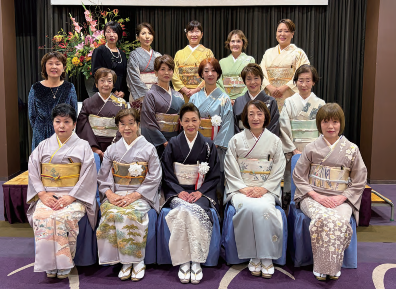
▲長浜商工会議所女性会創立 20 周年記念式典