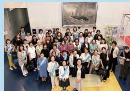
2025.9.17 県女連視察研修会 (兵神装備株式会社滋賀事業所)