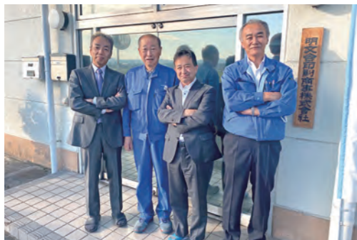
▲事務所前、役員の皆さままで